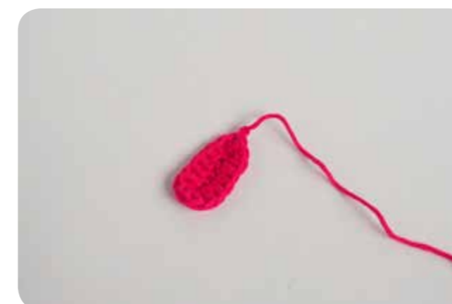
Hotový jazyk žabky