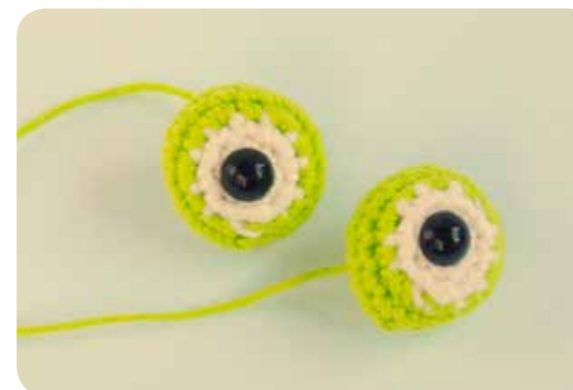
Hotové očička žabky